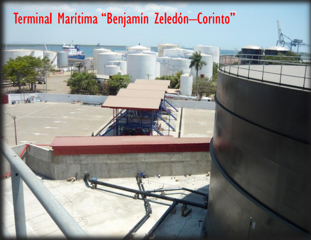
Terminal Marítima “Benjamín Zeledón—Corinto”